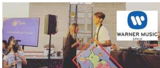
Imagen del lanzamiento de "Manila", la nueva cerveza de la marca. 2019